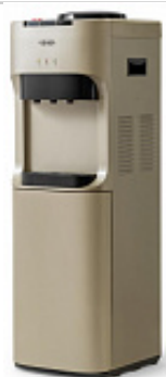
Кулер VATTEN V45QKB 4931

Баки горячей и холодной воды из нержавеющей стали. Три LED индикатора (включение питания, индикатор нагрева, индикатор охлаждения).